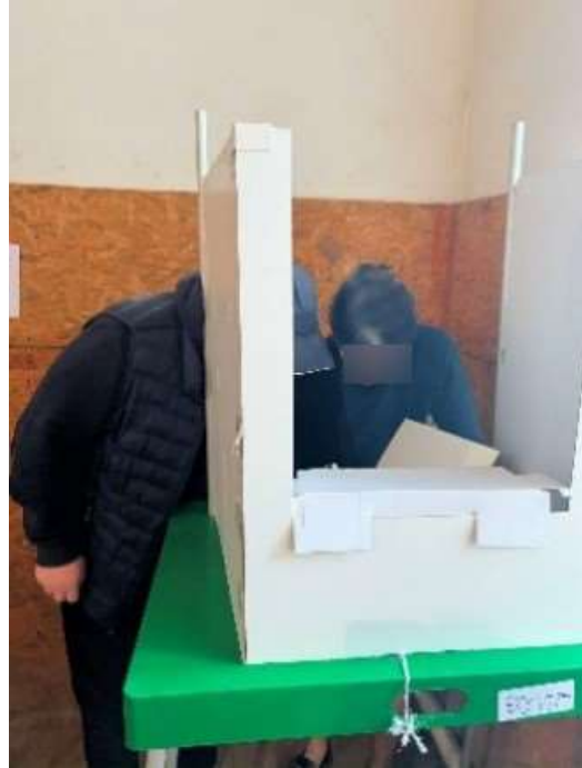
* მარნეულის №22 საარჩევნო ოლქის №03 საარჩევნო უბანზე ერთ კაბინაში მყოფი ორ-ორი პიროვნება.

ადამიანის უფლებათა ცენტრის დამკვირვებელთა განმარტებით, არაერთხელ დაფიქსირდა „ქართული ოცნების“ აგიტატორების მიერ ამომრჩევლებთან კენჭისყრის კაბინაში შეყოლის შემთხვევები გარდაბნის №21-ე ოლქის №16 უბანზე. იმავე სცენარით ხდებოდა ამომრჩევლებთან კაბინაში შეყოლა მარნეულის №22 ოლქის №48, №12 და №5 უბნებზე. დამატებით, გარდაბნის №21 ოლქის ნაზარლოს №32 უბანზე კომისიის თავმჯდომარე საარჩევნო კაბინაში ორი პირის ერთად შესვლას ხშირად ამართლებდა იმით, რომ ამომრჩეველმა გაუნათლებლობის გამო წერა-კითხვა არ იცისო. ხოლო, საგარეჯოს №11 საარჩევნო ოლქის №28 და № 29 საარჩევნო უბნებზე, როცა კაბინაში შეყოლა კომისიის წევრებმა ამომრჩევლის მხედველობის პრობლემით გაამართლეს, ცენტრის მონიტორმა დაინახა, როგორ მიუთითებდა შემყოლი პირი ამომრჩეველს 41 ნომრის შემოხაზვაზე, რაც მოქალაქემ ყოველგვარი მხედველობის პრობლემის გარეშე შეასრულა.